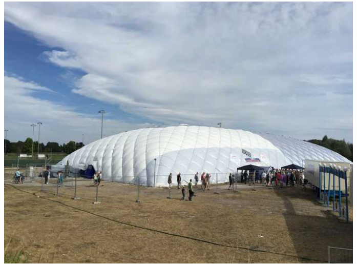
Die Taufkirchner Traglufthalle für Geflüchtete – Foto: SPD