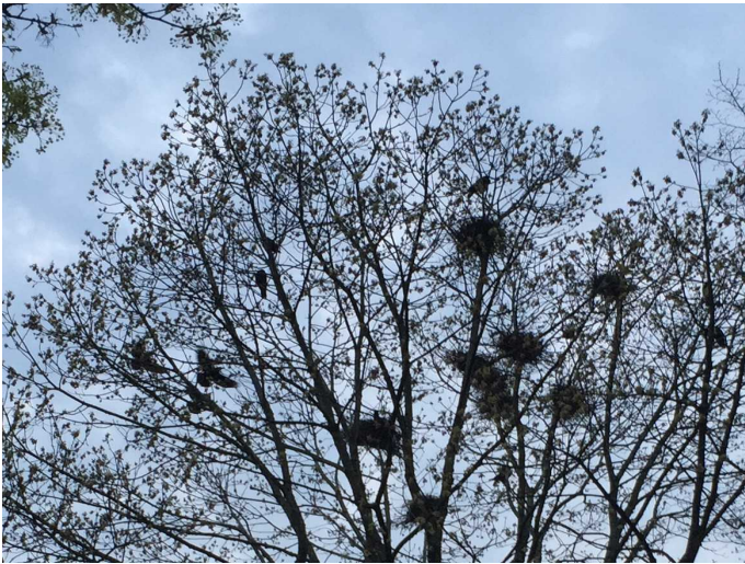
Krähenkolonie in der Waldstraße.