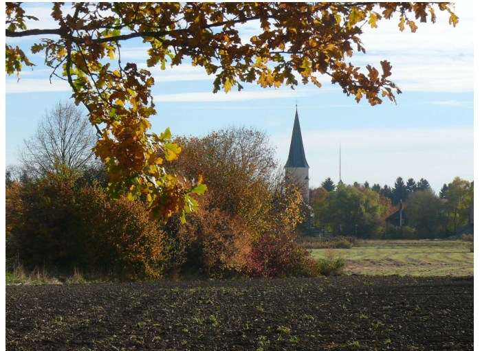
Taufkirchen: Blick auf St. Johannes der Täufer.

Grund genug für die SPD, regelmäßig aus der Gemeindepolitik zu berichten. Auf der Seite www.spd-taufkirchen.de erscheinen zahlreiche aktuelle Artikel rund um Taufkirchens Politik.