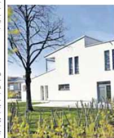
Die Sozialdemokraten fordern mehr Investitionen – wie jene in den Hort in der Pappelstraße.