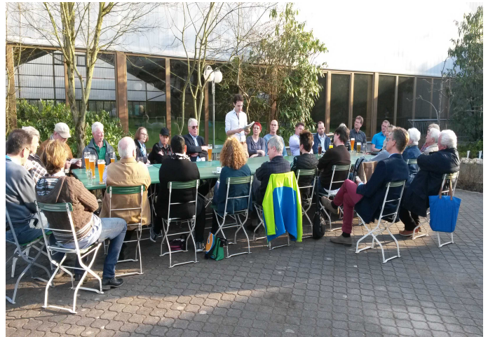
Über 30 interessierte Bürgerinnen und Bürger kamen zum Lärmschutz-Informationsgespräch der SPD im März.

Deswegen ist es besonders erfreulich, dass sich mit dem Bündnis 90 / Die Grünen, der FDP/FWG, der ILT und den Freien Wählern, fast alle Taufkirchner Parteien gemeinsam um den Lärmschutz bemühen.