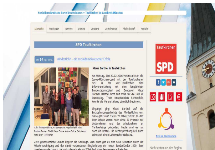
Immer aktuell: Der Online-Auftritt der SPD-Taufkirchen.

Neben der ständig aktuellen Internetseite verbreitet die SPD ihre Informationen daher auch über Facebook, Twitter und Youtube.