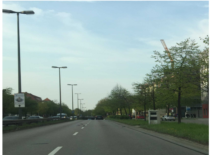
Ein Blitzer könnte helfen, wie hier an der Landshuter Allee.

Schließlich formierte sich 2011 ein eigener Verein, der Lärmfreies Taufkirchen e. V. unter der Mitwirkung der ehemaligen Bürgermeister Riedle und Pötke. Parallel zu den Bestrebungen des Vereins folgten verschiedene Beschlüsse im Gemeinderat. Dabei wurde unter anderem beschlossen, dass Konzepte für eine neue Lärmschutzwand erstellt und lärmmindernder Asphalt verlegt werden sollen.