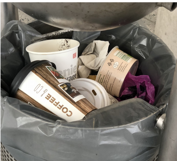
Auch Einwegbecher sollen nach dem Willen der SPD verschwinden

Mitte des Jahres hatte die SPD bereits mit Erfolg einen Antrag im Gemeinderat durchgebracht, um für Mehrwegsysteme insbesondere bei To-Go-Bechern zu werben.