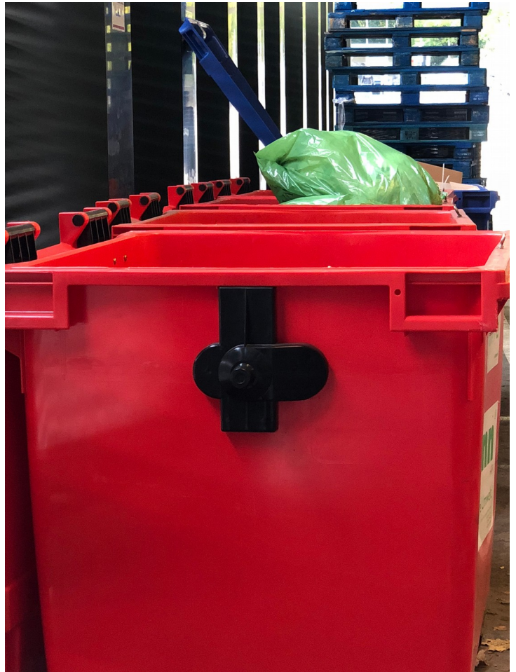
Plastik in großen Mengen vermeiden

Auf einer Mitgliederversammlung votierten die Taufkirchner SPD-Mitglieder einstimmig für den Gemeinderatsantrag, der im November vom Rat schließlich mehrheitlich beschlossen wurde.