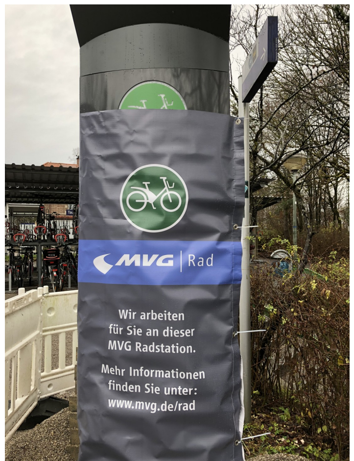
Künftige MVG-Radstation am Taufkirchner Bahnhof

Fraktionsvize Matteo Dolce sagt dazu: "Endlich zieht Taufkirchen bei solchen elementaren Angeboten nach und stellt eine sinnvolle Einrichtung für die Bürgerinnen und Bürger zur Verfügung."