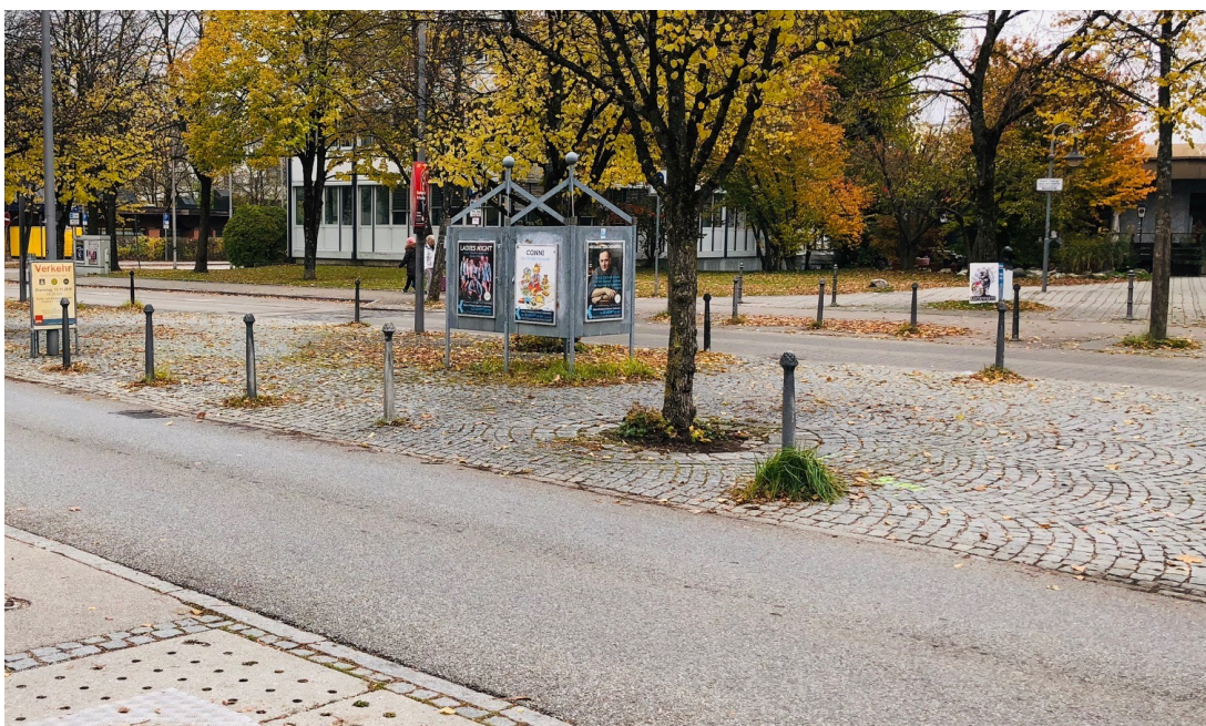
Bald mit Zebrastrifen: Der Übergang zwischen Eschen- und Lindenpassage

Der entsprechende Antrag wurde im Gemeinderat mehrheitlich abgelehnt.