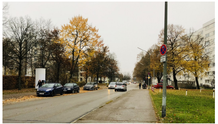
Der Lindenring in Taufkirchen: Hier soll auch auf dem Gehweg geradelt werden dürfen.

Dort kommt es immer wieder zu unklaren Verkehrssituationen.